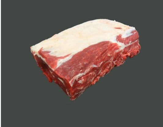
FOTO TAGLIO ANATOMICO