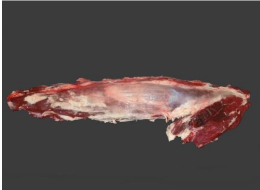
FOTO TAGLIO ANATOMICO