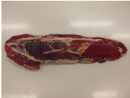
FOTO TAGLIO ANATOMICO